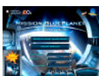
- „MISSION BLUE PLANET“ -